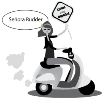
Tabla De Materias